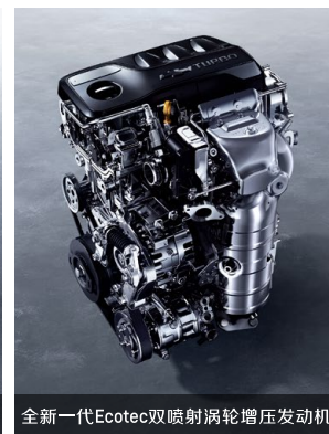
全新一代Ecotec双喷射涡轮增压发动机