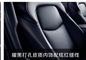
曜黑打孔皮质内饰配炫红缝线