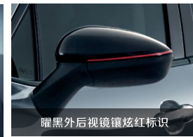
曜黑后视镜镶炫红标识