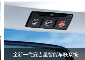
全新一代安吉星智能车联系统