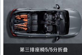
第三排座椅5/5分折叠