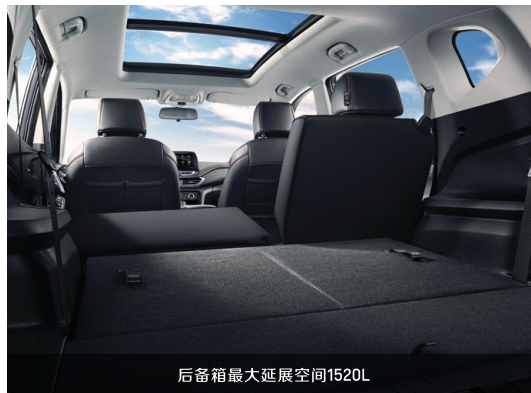
后备箱最大延展空间1520L