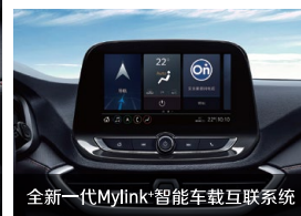
全新一代Mylink+智能车载互联系统