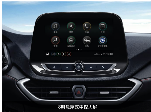
8吋悬浮式中控大屏