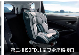
第二排ISOFIX儿童安全座椅接口