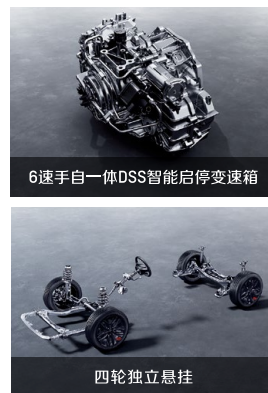
6速手自一体DSS智能启停变速箱