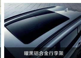
曜黑铝合金行李架