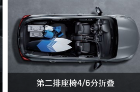
第二排座椅4/6分折叠