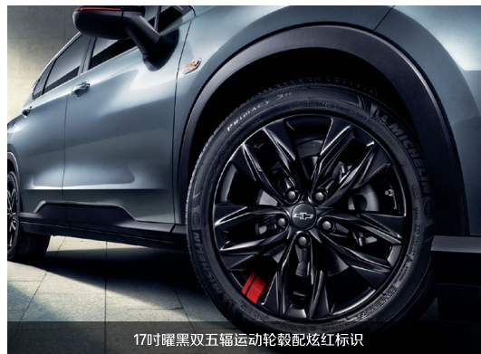
17吋曜黑双五辐运动轮毂配炫红标识