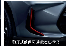
獠牙式前保风道镶炫红标识