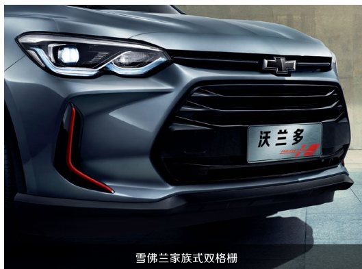
雪佛兰家族式双格栅